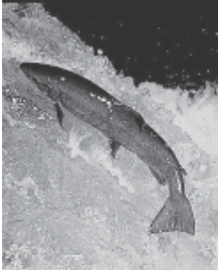
အမေရိကန်နိုင်ငံအတွင်းရှိ ရေကာတာများကြောင့် နိုင်ငံ၏ ဆော်လ်ဗွန်ငါးများစွာကို သေကြေပျက်စီး ဆုံးရှုံးစေခဲ့သည်။

ရေကာတာဆောက်လုပ်ခြင်းကြောင့် ပြန်လည်နေရာချစီမံပေးထား သည့်နေရာများအတွင်းနေထိုင်သူများမှာ သောက်ရေသန့်အလုံအလောက် မရရှိခြင်း (သို့) အစားအစာအလုံအလောက်မရှိခြင်းတို့နှင့် ရင်ဆိုင်ကြုံတွေ့ ကြရသည်။ ၎င်းတို့မှာ ဆင်းရဲငတ်အတွင်းကျဆင်းကြရသည်။ ၎င်းတို့နေသား တကျဖြစ်နေသော ဝမ်းရေးရှာရပ်တည်ရသည့် ထုံးတမ်းစေလွှာများ၊ မြေယာ များ၊ သဘာဝအရင်းအမြစ်များကိုလည်း ဆုံးရှုံးရမှုဖြင့် နတ္ထိဗလာဖြစ်ခဲ့ကြရ ခြင်းကြောင့် ၎င်းတို့၏ လူမှုအသိုင်းအဝိုင်းများအား နှောင့်ဖွဲ့ထားသည့် လူမှု အဆောက်အအုံနှောင်ကြီးများမှာ ဆုတ်ပြင်ကြေမှုပျက်စီးသွားခဲ့ရသည်။ ယင်း ကြောင့်ပင် ထိုသို့သောအသိုင်းအဝိုင်းများအတွင်း အရက်စွဲခြင်း၊ စိတ်ဓါတ်ကျ