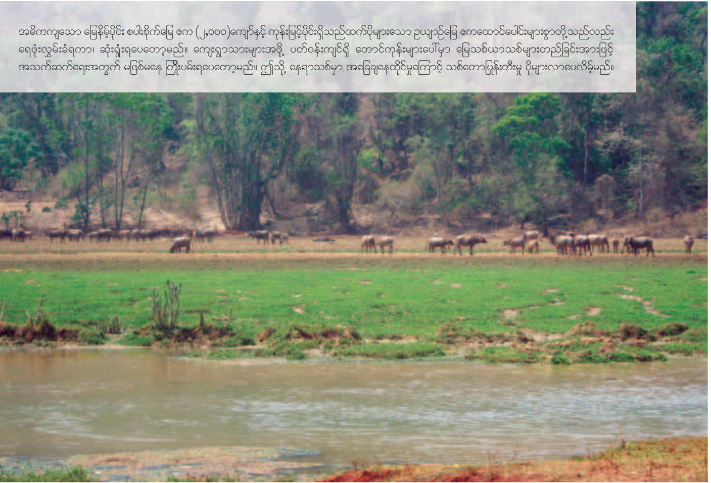
အဓိကကျသော မြေနိမ့်ပိုင်း စပါးစိုက်မြေ ဧက (၂,၀၀၀)ကျော်နှင့် ကုန်းမြင့်ပိုင်းရှိသည်ထက်ပိုများသော ဥယျာဉ်မြေ ဧကထောင်ပေါင်းများစွာတို့သည်လည်း ရေဖုံးလွှမ်းခံရကာ၊ ဆုံးရှုံးရပေတော့မည်။ ကျေးရွာသားများအဖို့ ပတ်ဝန်းကျင်ရှိ တောင်ကုန်းများပေါ်မှာ မြေသစ်ယာသစ်များတည်ခြင်းအားဖြင့် အသက်ဆက်ရေးအတွက် မဖြစ်မနေ ကြိုးပမ်းရပေတော့မည်။ ဤသို့ နေရာသစ်မှာ အခြေချနေထိုင်မှုကြောင့် သစ်တောပြုန်းတီးမှု ပိုများလာပေလိမ့်မည်။

ဤနှစ်တွင် ကျေးရွာသားများသည် နေရာရွှေ့ပြောင်းရမှုနှင့် ကြုံတွေ့နေပါသည်။ သို့ ဖြစ်သည့်တိုင် အာဏာပိုင်များထံ မိမိတို့၏ နှစ်နာချက်များနှင့်ပတ်သက်၍ တိုင်တန်းပြောဆို ခဲ့ခြင်းမရှိသည့်အဖြစ်သို့ ရောက်နေပါသည်။ မည်သူ့ထံသို့ တိုင်တန်းရမည်၊ မိမိတို့၏ အသံကို ကြားအောင် မည်သို့လုပ်ရမည် ဆိုသည်တို့ကို သူတို့ မသိကြချေ။