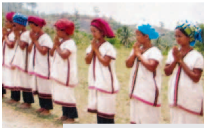
ပေါင်းလောင်းဒေသရှိ ကယန်းအမျိုးသမီးများ၏ ရိုးရာဝတ်စုံအလှ

ဆည်အမြင့်ကြောင့် ပေါင်းလောင်းမြစ်ကြောင်းတလျှောက်ရှိ သစ်တောများရေမြုပ်သွားတော့ မည်ဖြစ်ပြီး၊ တိရစ္ဆာန်များနှင့် ၎င်းင်းတို့၏ စားကျက်များပါ ရေမြုပ်သွားတော့မည် ဖြစ်သည်။ သမင်၊ ဝက်၊ လိပ်ကဲ့သို့သော တောရိုင်းတိရစ္ဆာန်များအပို့လည်း ၎င်းင်းတို့၏ ခိုလှုံကျက်စား ရာနေရာများ ဆုံးရှုံးပေတော့မည်။ ဆည်ကြောင့် ငါးမျိုးစိတ်များ၏ အရေအတွက်နှင့် အမျိုး အစားများသည်လည်း ဆုတ်ယုတ်သွားလိမ့်မည်ဖြစ်ပြီး၊ အစားအစာနှင့် ဝင်ငွေအပိုရရှိရေး အတွက် တံငါလုပ်ငန်း အပေါ် အားထားနေရသော လူထောင်ပေါင်းများစွာတို့၏ ဂိုဏ်းကွဲလှဲခြင်းကို ထိခိုက်စေပေလိမ့်မည်။