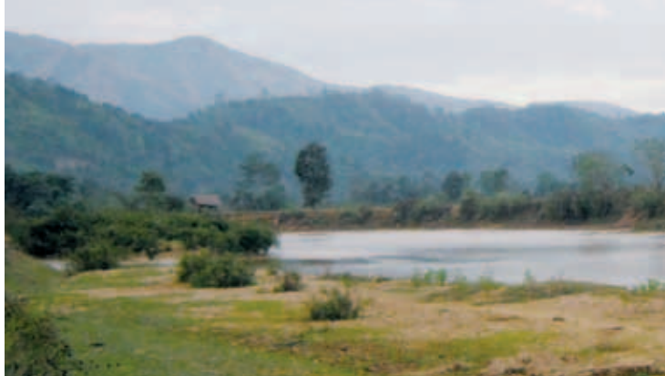
မြစ်တလျှောက်ရှိ မြေသြဇာကောင်းသော မြေများသည် ရေအောက်သို့ လုံးဝ ကျရောက်သွားမည်ဖြစ်သည်။