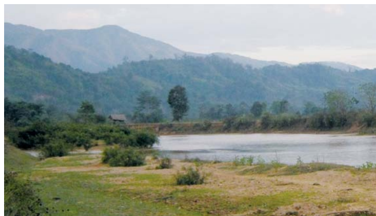
沿河肥沃的平原将全部被淹