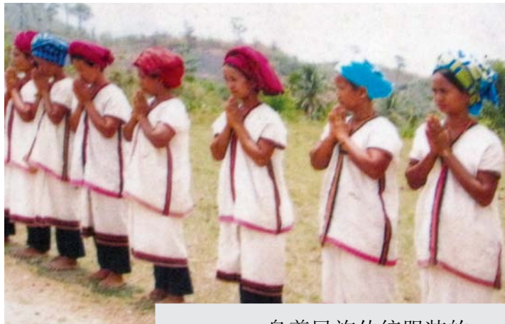
身着民族传统服装的邦朗地区克耶族妇女

从大坝的高度来判断，邦朗河沿线的森林，以及其间的动物、牧场都将被淹没。野生动物，如鹿、熊和龟等，也将失去它们的栖息地。大坝还会减少鱼的数量和种类，影响到数千名靠捕鱼来补充膳食和收入的人们的粮食安全。